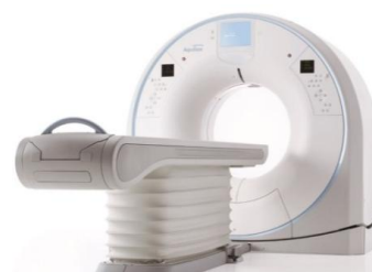
☆ 最新型80列CT装置 ☆